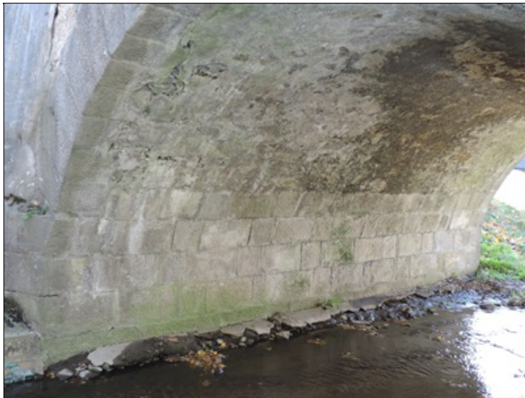
Pohled na opěru č. 1