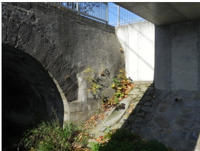
Křídlo č. 2 - pravá strana