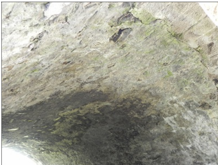
Podhled na nosnou konstrukci