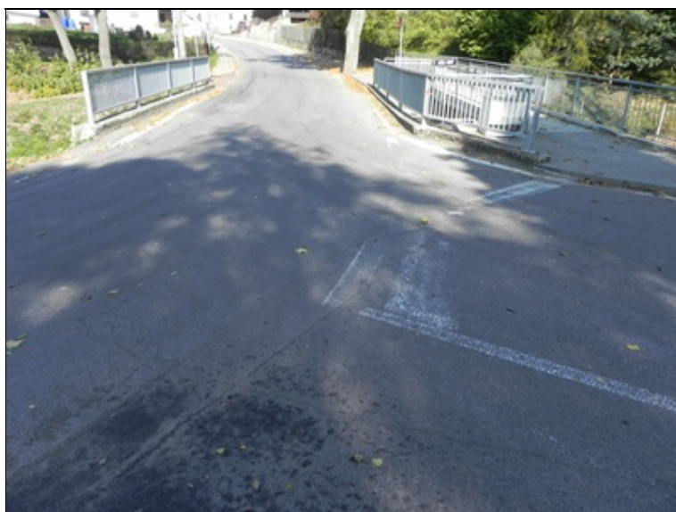
Pohled ve směru staničení