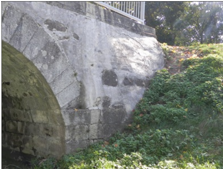
Křídlo č. 1 - levá strana