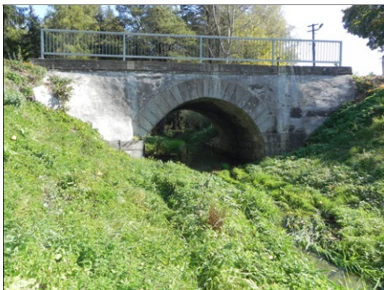
Celkový pohled levá strana - POS