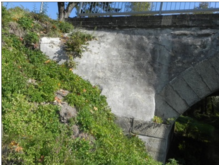
Křídlo č. 2 - levá strana