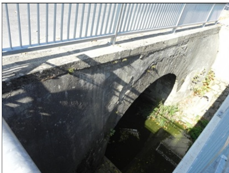
Celkový pohled pravá strana - NAS