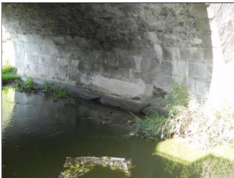
Pohled na opěru č. 2