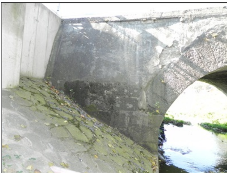
Křídlo č. 1 - pravá strana